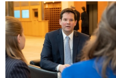
„Es ist eine Freude, für unsere Landsleute da sein zu dürfen. Da geht es um unsere Anliegen und Interessen.“

Es geht jährlich um 500 Millionen an Fördermitteln für Projekte wie grenzüberschreitende Gesundheitsversorgung sowie Aktivitäten von Klein- und Mittelbetrieben oder der Zivilgesellschaft in NÖ. Ein Drittel der Regionalförderung fließt in unsere Landwirtschaft. Ich kämpfe dafür, im nächsten EU-Budget die Regionalförderung zu erhalten. Das wird nach